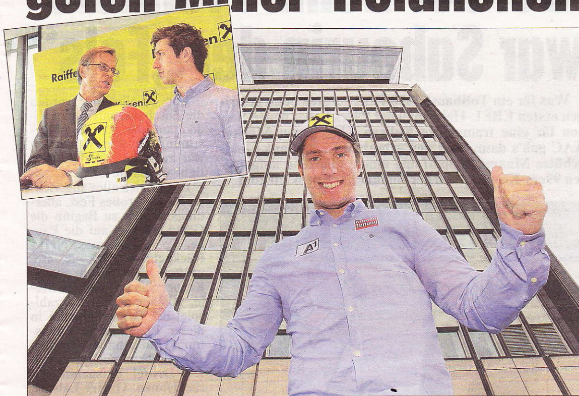
Marcel Hirscher auf Wien-Bummel und bei der Vertragsunterzeichnung mit Leo Pruscha (kl. Bild)